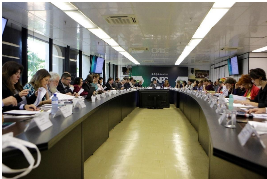
1ª Reunião Extraordinária e Posse dos novos membros do CNPC mandato 2019/2022.

A ata da reunião com as principais deliberações está disposta no documento SEI 0756104.