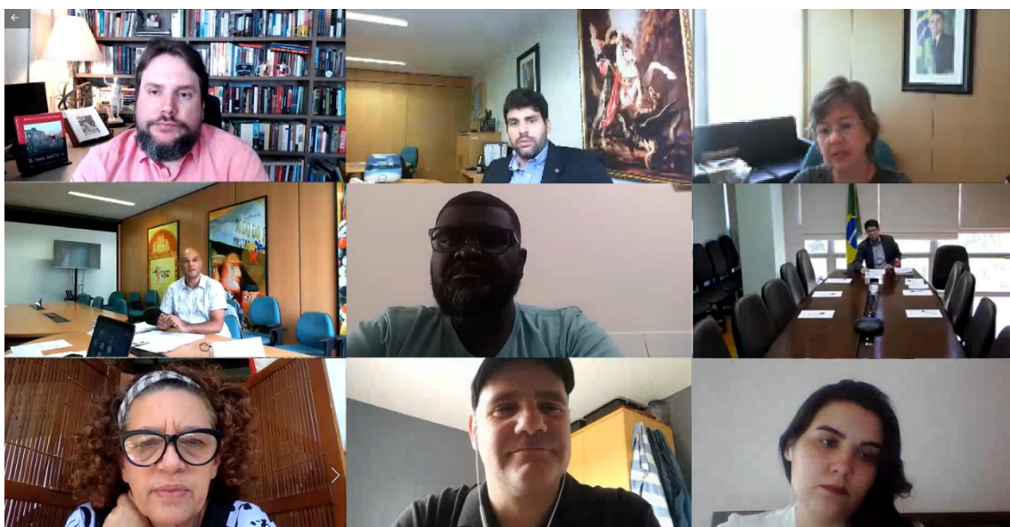
28ª reunião ordinária do CNPC em formato virtual – 26 e 27/11/2020.