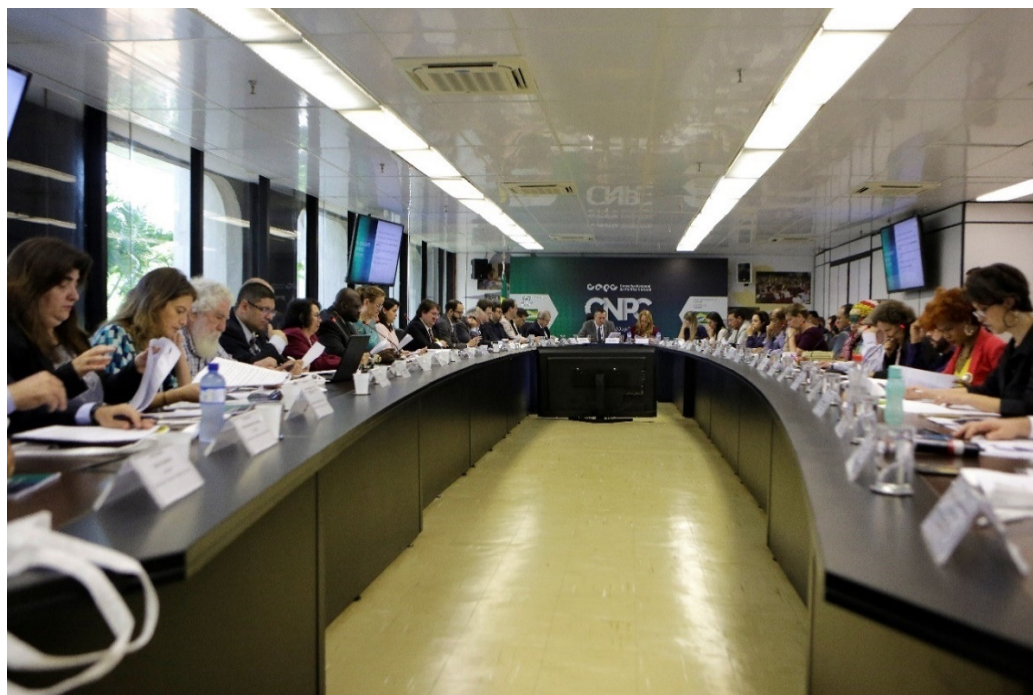
1ª Reunião Extraordinária e Posse dos novos membros do CNPC mandato 2019/2022.

A ata da reunião com as principais deliberações está disposta no documento SEI 0756104.